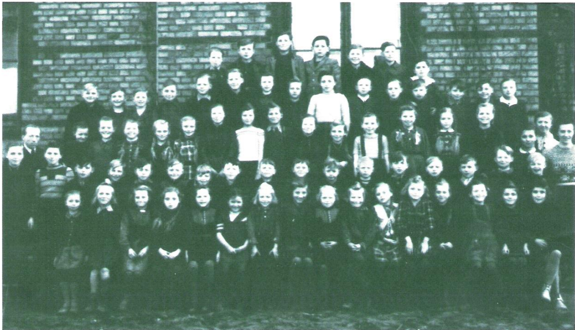
Abb. 2: Viele, viele Schulkinder (1948)